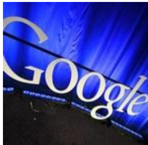
小企业可以向 Google学什么