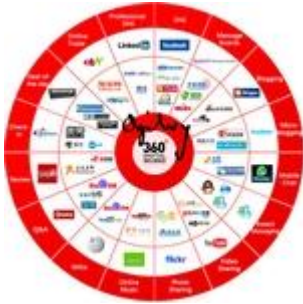
全球 社交媒体纵览