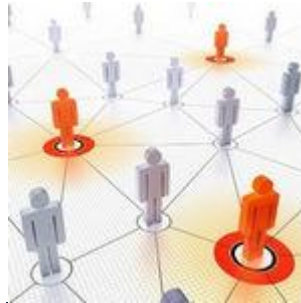
社交网络 的三种图谱